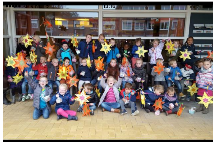
Groep 1 en 1/2 met Sint Maarten